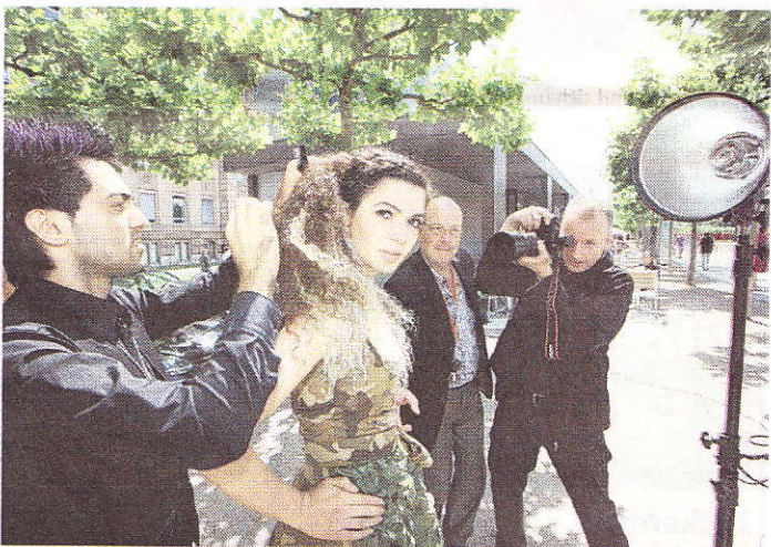
Viele Zuschauer hatte das Fotoshooting des Designertreffs bei KIT am Rhein.