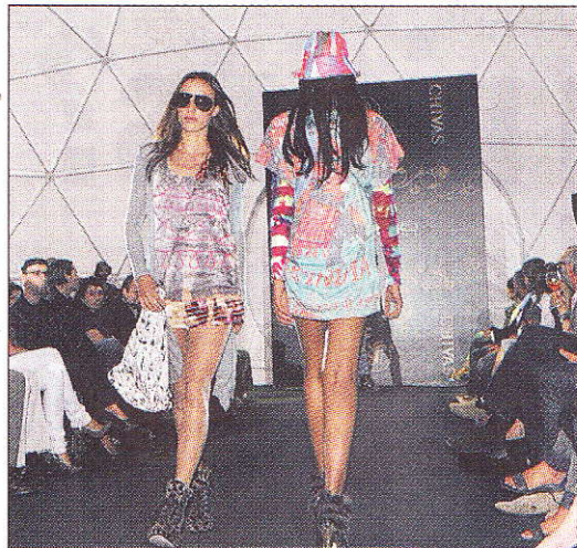
Schriller Farben- und Muster-Mix bei Custo Barcelona für den nächsten Sommer