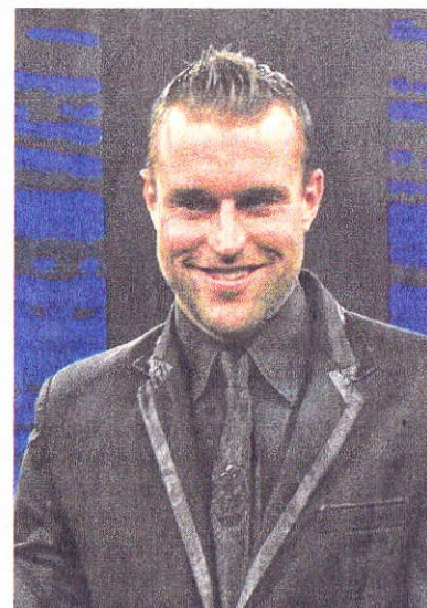
Philipp Plein zeigt seine Kollektion im Intercontinental.